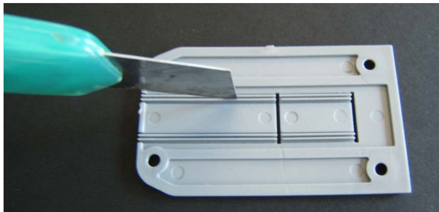
Fig.2 Scarico dei tappi

Se si utilizza la pinza SVP 80 si deve eseguire lo scarico fino al primo foro orizzontale rettangolare.